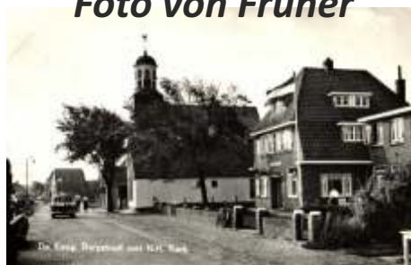
Foto von Früher